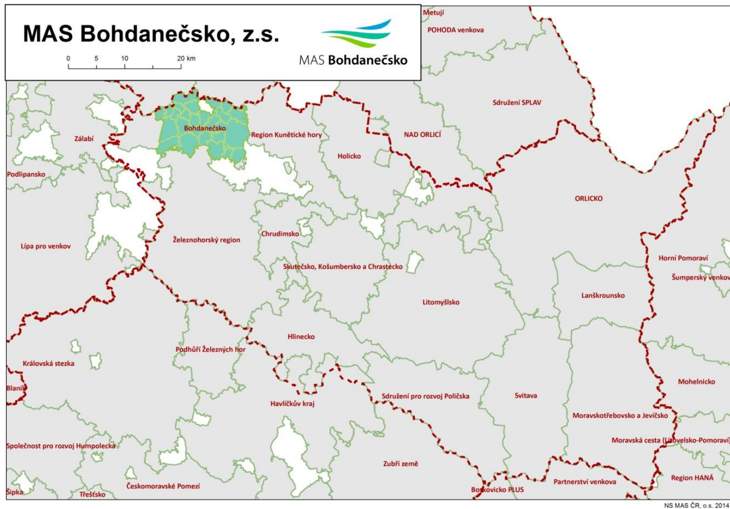
Obrázek č. 2 Území MAS Bohdanečsko v krajském kontextu