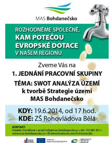
Obr. 7 Pozvánka na setkání pracovní skupiny