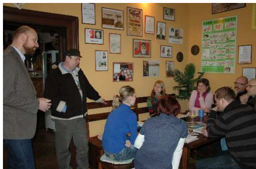
Obr. 5 Jednání certifikační komise Kraj Pernštejnů

MAS Bohdanečsko spolupracuje se sousedními regiony MAS Region Kunětické hory a MAS Holicko na Projektu regionálního značení. Cílem projektu, který zaštiťuje Asociace regionálních značek, je podpora odbytu místním producentům, jejichž výrobky vykazují vysokou kvalitu, vysoký podíl ruční práce