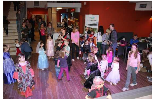
Obr. 3 Společenské odpoledne pro děti a rodiče