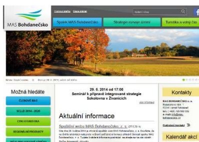
Obr. 4 Webové stránky MAS

4. V rámci tohoto výstupu byly vytvořeny propagační materiály o činnosti MAS Bohdanečsko: propagační brožura o činnosti, členech a území MAS Bohdanečsko, leták s výzvou k zapojení se do regionu, roll-up banner MAS Bohdanečsko, karty členů, vizitky a propisky. Tyto předměty jsou využívány při reprezentaci MAS na akcích regionálního i nadregionálního významu.