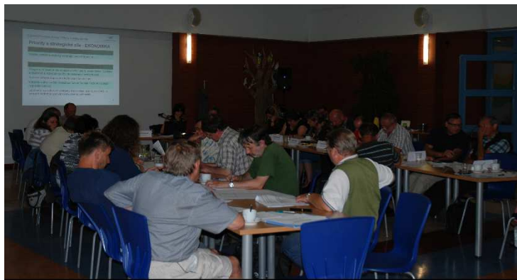
Obr. 8 Setkání pracovní skupiny k tvorbě SCLLD

V průběhu dubna až srpna 2014 byl na území MAS Bohdanečsko realizován Projekt „Podpora vzniku strategie komunitně vedeného místního rozvoje pro území MAS Bohdanečsko“, který byl podpořen z Operačního programu Technická pomoc. V rámci tohoto projektu byla zpracována analytická a strategická část SCLLD. Podkladem pro zpracování byly mj. i výstupy z pracovní skupiny pro tvorbu SCLLD. Pracovní skupina byla vytvořena z členů MAS Bohdanečsko a aktivních činitelů území veřejného, neziskového i podnikatelského sektoru. Projekt byl předfinancován krátkodobým provozním úvěrem České spořitelny. Dotace ve výši 491 359,- Kč byla MAS Bohdanečsku proplacena po ukončení realizace Projektu.