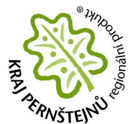
Obr. 6 Logo značky