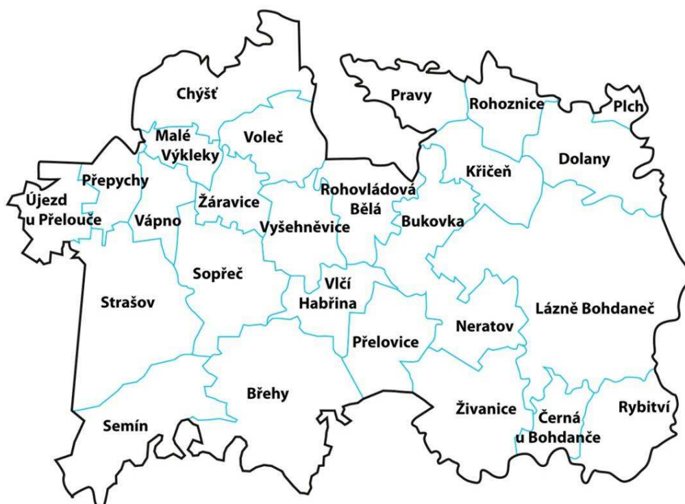
Obr. 1 Mapa území MAS Bohdanečsko

MAS Bohdanečsko je neziskovou organizací, která pracuje na principu metody LEADER. Metoda LEADER je založena na tzv. „přístupu zdola“ s tím, že rozhodovací pravomoc týkající se vypracování a provádění strategií místního rozvoje náleží právě místní akční skupině. Smyslem této metody je zapojit do spolurozhodování o rozvoji regionu aktéry, kteří v regionu žijí a vědí tak, co dané území potřebuje.