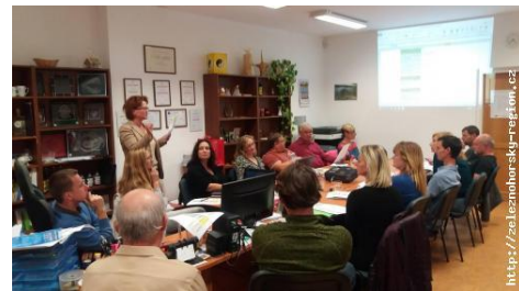
Jednání realizačního týmu MAP II 1. 10. 2018 v Heřmanově Městci

Tvorba Místních akčních plánů je podmínkou pro čerpání financí z IROP. Veškeré investiční projektové záměry škol musí být zaneseny v tzv. Strategickém rámci MAP.