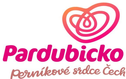
Logo Pardubicko - Perníkové srdce Čech, z. s.

MAS Bohdanečko se v červnu účastnila ve spolupráci s městem Lázně Bohdaneč Dětského dne.