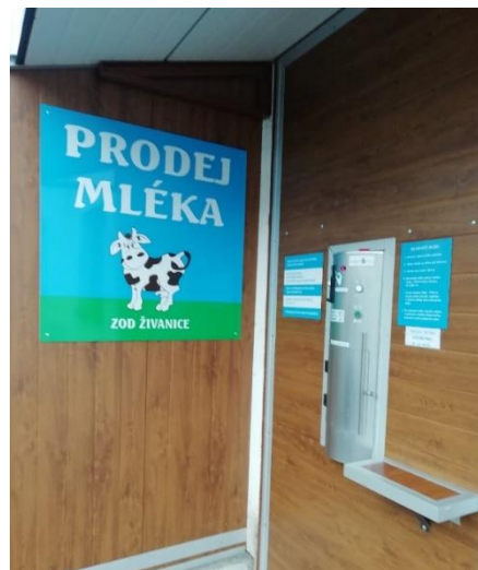
Certifikovaný výrobek: „Syrové kravské mléko ze Živanic“