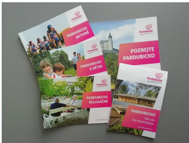
Sada propagačních materiálů o území Pardubicka.

Manažerka MAS se v říjnu 2019 zúčastnila Konference Venkov, která se uskutečnila v Klášteře Teplá v Karlovarském kraji.