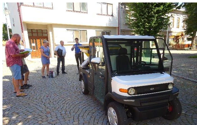
Prezentace užitkového nákladního elektromobilu určeného pro komunální údržbu v obcích, Lázně Bohdaneč 4. 9. 2019