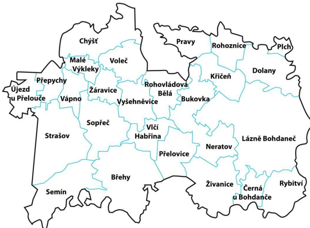
Obr. 1 Mapa území MAS Bohdanečsko

MAS Bohdanečsko je neziskovou organizací, která pracuje na principu metody LEADER. Metoda LEADER je založena na tzv. „přístupu zdola“ s tím, že rozhodovací pravomoc týkající se vypracování a provádění strategií místního rozvoje náleží právě místní akční skupině. Smyslem této metody je zapojit do spolurozhodování o rozvoji regionu aktéry, kteří v regionu žijí a vědí tak, co dané území potřebuje.