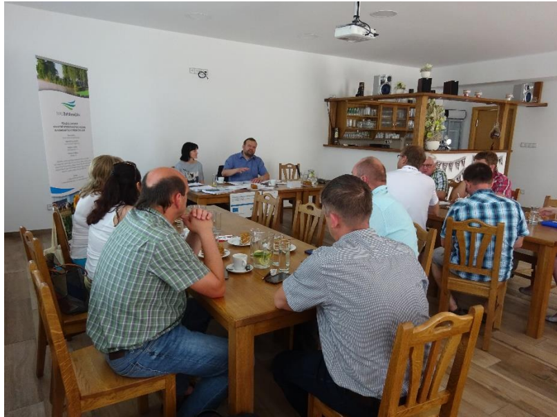
Jednání fokusní skupiny k mid-term evaluaci Strategie MAS, Dolany 3. 6. 2019

V prvním pololetí roku 2019 proběhla tzv. mid-term evaluace Strategie MAS, tj. zhodnocení realizace v polovině období. K datu 31. 12. 2018 byla vyhodnocena veškerá činnost MAS, vyhlášené výzvy, efekty realizovaných projektů, relevance zaměření realizovaných opatření aj. Důležitá data pro zpracování evaluace byly mj. i rozhovory s realizátory projektů, na základě kterých byly zpracovány případové studie, jednání orgánů MAS a také jednání tzv. fokusní skupiny (Dolany, 3. června 2019). Mezi členy fokusní skupiny byli příjemci dotací, členové orgánů MAS, zástupci obcí a odborné veřejnosti. Výstupem evaluace je tzv. evaluační zpráva . Evaluační zprávu ze strany MAS schvalovala Kontrolní komise, následně byla odeslána dne 29. 6. 2019 ke schválení ŘO a schválena byla dne 8. 10. 2019.