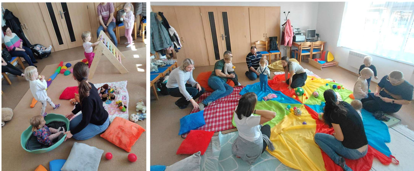
Obrázek 3 Setkávání rodičů s dětmi v Sopřeči

Na podzim roku 2025 jsme zahájili pravidelné komunitní setkávání rodičů s dětmi v obci Sopřeč. Setkávání probíhala ve spolupráci s obcí 1x za 14 dní od 9:30 ve společenské místnosti obecního úřadu.