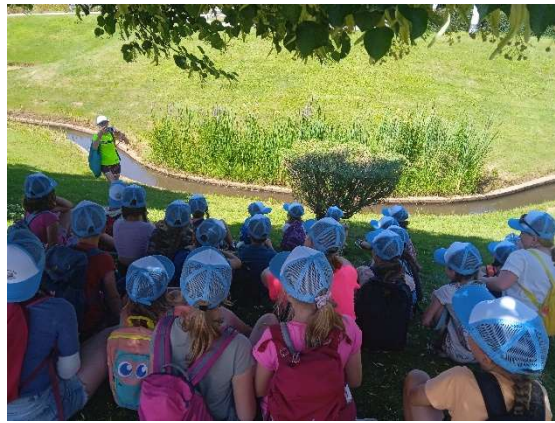
Obr.: Podpora spolků při realizaci letních komunitních táborů