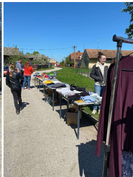
Obr.: SWAP Strašov