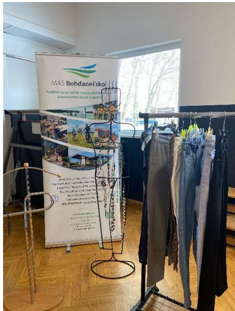
Obr.: SWAP Břehy