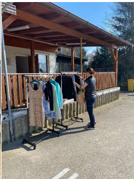
Obr.: SWAP Břehy