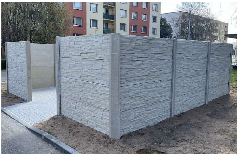
Obrázek 1: Vybudování 2 kontejnerových stání na komunální a separovaný odpad v Lázních Bohdančí

Pro další výzvu v roce 2026 je připravena alokace 4 646 580,00 Kč pro všechny Fiche a stále probíhá příprava projektu pro Fichi 07 – Projekt spolupráce.