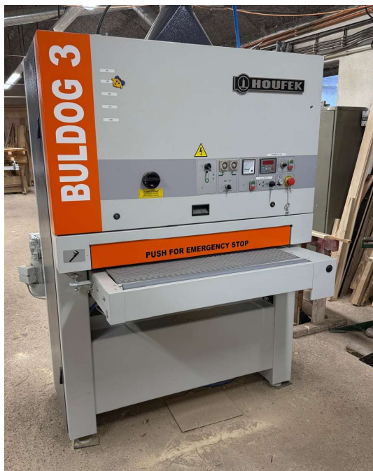
Obrázek 2: Investice do technologie Truhlářství Mrštík s.r.o.